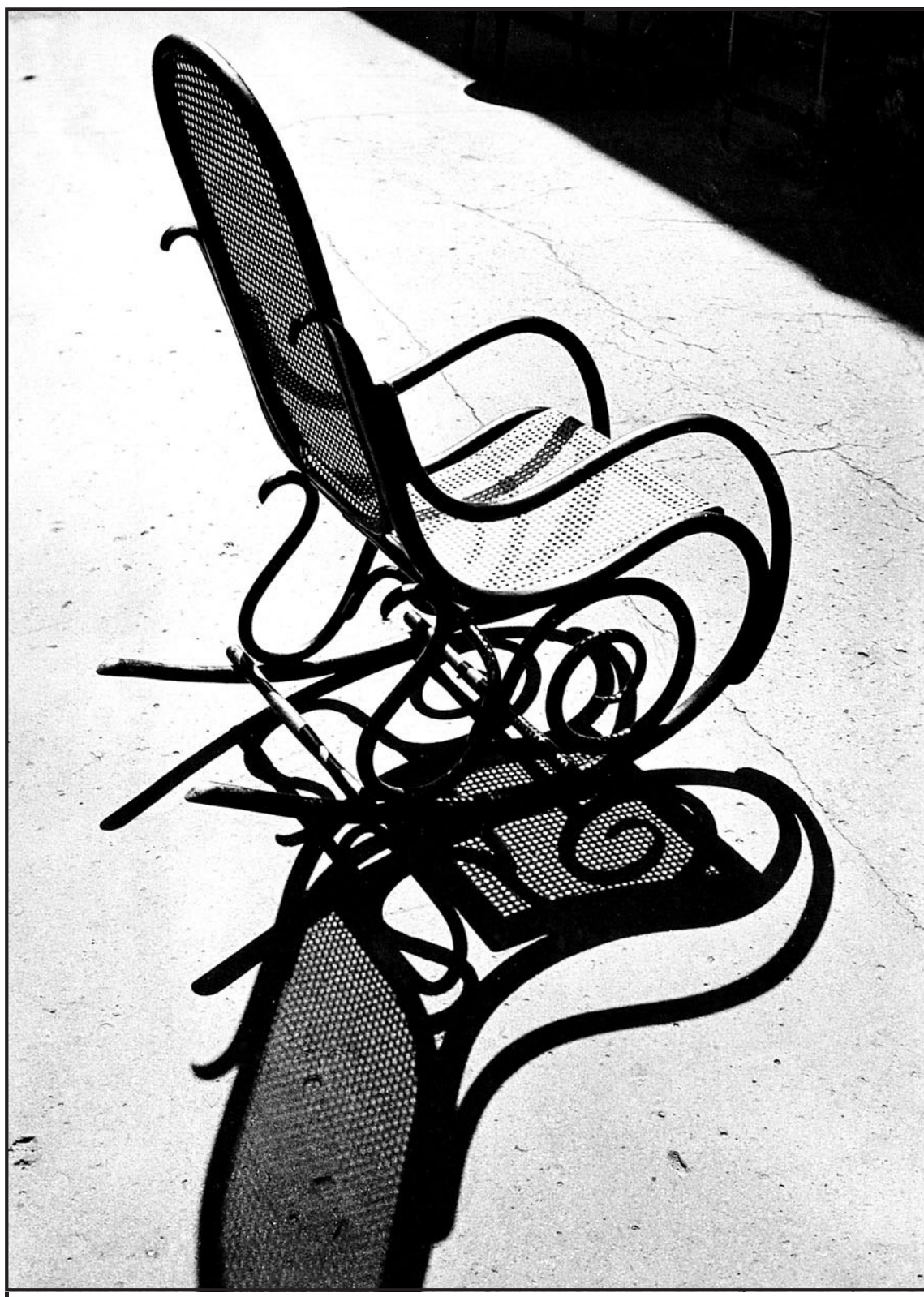
RIPOSO ATTIVO Parigi 1963. Una sedia a dondolo in vendita in un mercatino delle pulci vista da Alfred Eisenstaedt

Da questo punto di vista, «inerzia» è, come «vacanza» (alla quale la lega una certa affinità...),